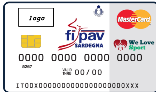
CARTA PREPAGATA BRANDIZZATA FIPAV

le carte Fipav veicolano l'immagine e i colori sociali, aumenta la fidelizzazione degli associati e dal loro utilizzo si ottiene un vantaggio economico